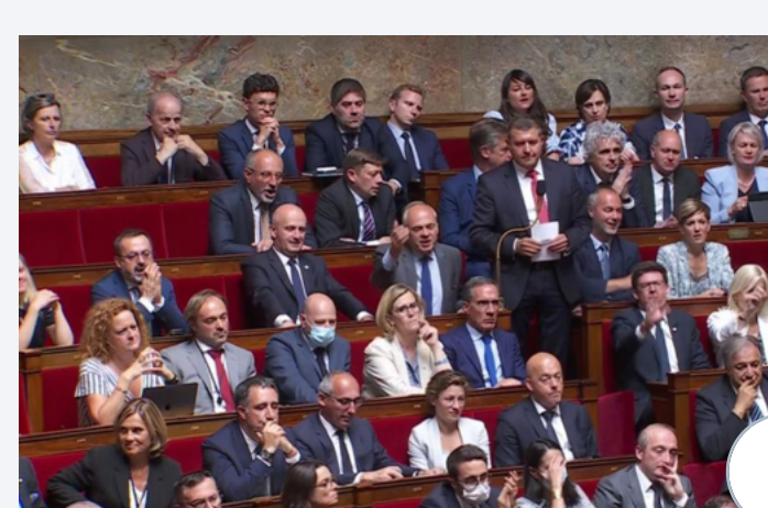
Assemblée nationale : une possible utilisation du 49.3 pour budget